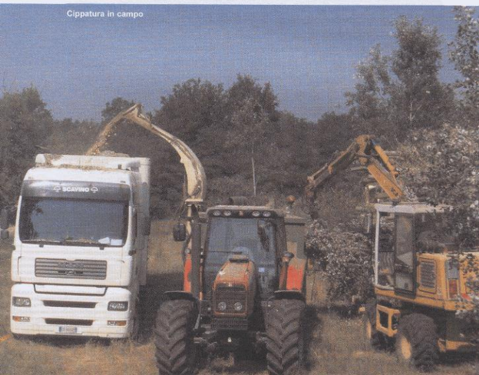
Cippatura in campo

Si ritiene quindi che la massima efficienza con utilizzo di biomassa sia la produzione d'energia termica o, meglio ancora, di energia termica ed energia elettrica (cogenerazione) ove però l'energia elettrica sia prodotta in stretto rapporto alla quantità di calore utilizzabile. Considerando che il rapporto di produ-